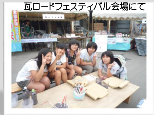
瓦ロードフェスティバル会場にて